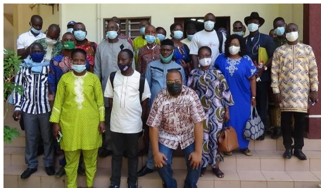
Participants aux tables rondes régionales