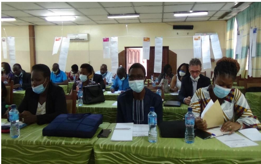
Photo de quelques participants à la table ronde nationale