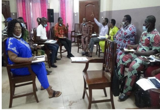
Travaux de groupe et restitution lors des tables rondes régionales