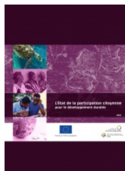
L'État de la participation citoyenne pour le développement durable