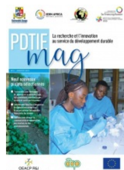
PDTIE mag - No 2 La recherche et l'innovation au service du développement durable