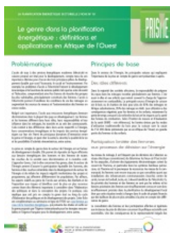
Le genre dans la planification énergétique définitions et applications en Afrique

Consultez les dernières publications dans les domaines de l'énergie, de l'environnement et du développement durable.