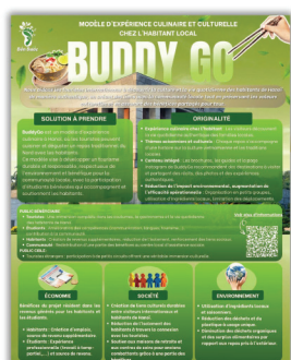
Le Pas Durable Buddy Go Modèle d'expérience culinaire et culturelle chez l'habitant local