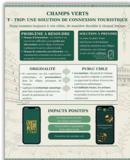
Champs Verts Système de mise en relation entre les artisans, les visiteurs et les autorités locales pour le village artisanal de la nacre de Chuyên Mỹ